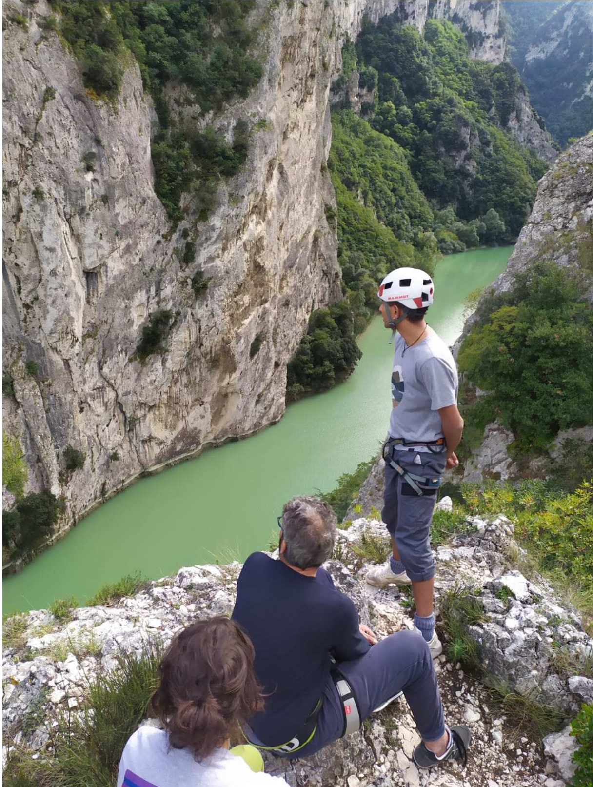
Gole del Furlo, 30 settembre 2020