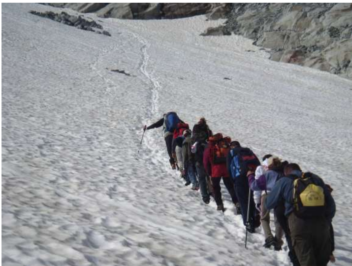
I ragazzi in cammino alle pendici dell'Adamello

In tempi di doloroso degrado del valore della vita, anche piccoli esempi virtuosi, in questo caso offerti dalla Montagna, meritano di essere valorizzati e promossi con forte determinazione.