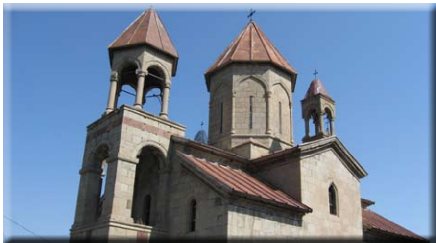
Chiesa tipica della Georgia