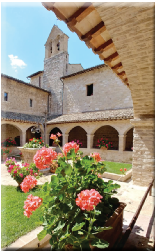
Chiostro San Damiano

La cena ha segnato un momento di una più concreta condivisione tra noi. Infatti il senso del pellegrinaggio aveva la sua espressività nella condivisione di ogni aspetto