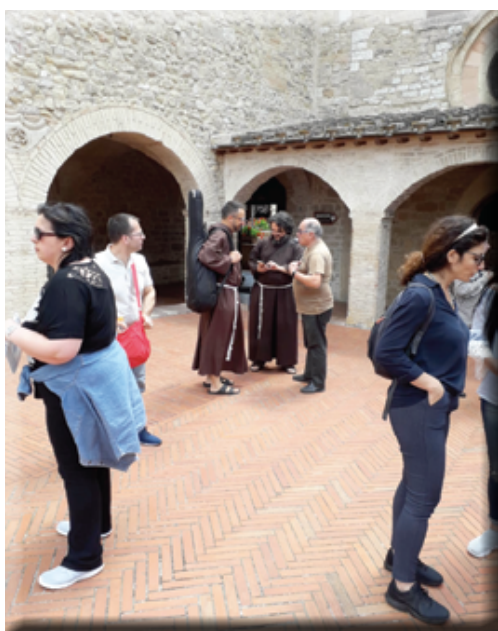
Piazzetta San Damiano