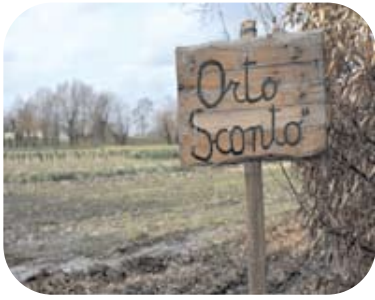
Tutte cose di Orto Sconto