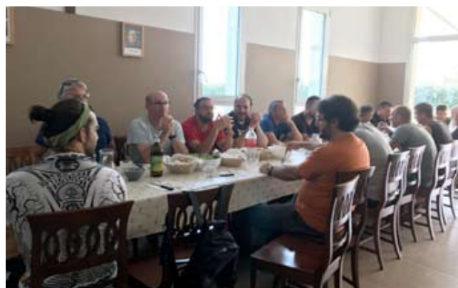
Caorle - a tavola