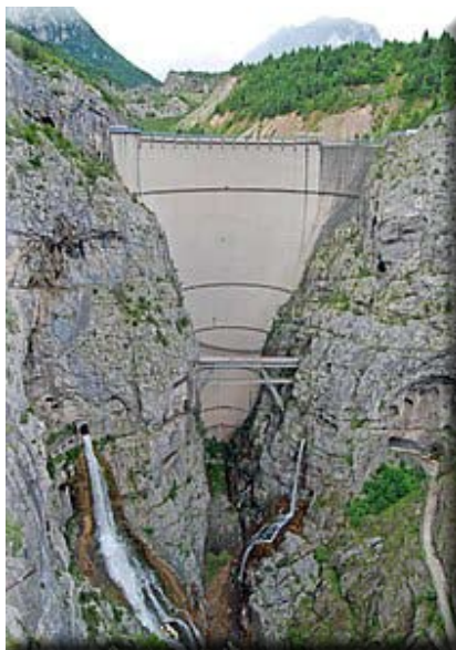
La diga del Vajont