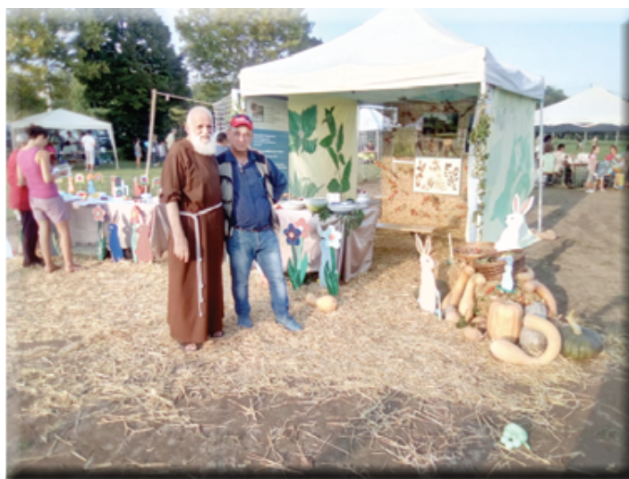
Festa delle associazioni di volontariato-Asolo