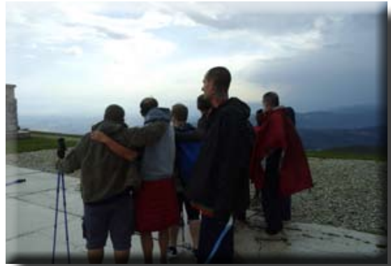
Sul sacrario del Grappa

Questo evento ci ha donato la percezione di una grande libertà e serenità che ci veniva incontro per riempirci il