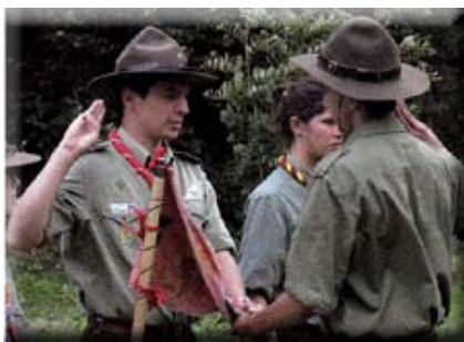
Il saluto scout

Di solito tra gli scout ci sono due saluti: i più giovani fanno il saluto ai capi con medio e indice alzati e distaccati tra di loro e il pollice che, stando sopra alle altre dita, significa che il più debole è protetto dai