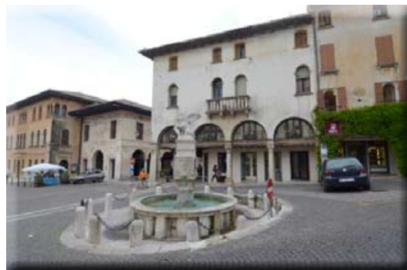
Asolo- Piazza centrale