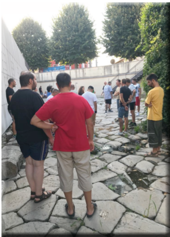
Concordia - strada romana