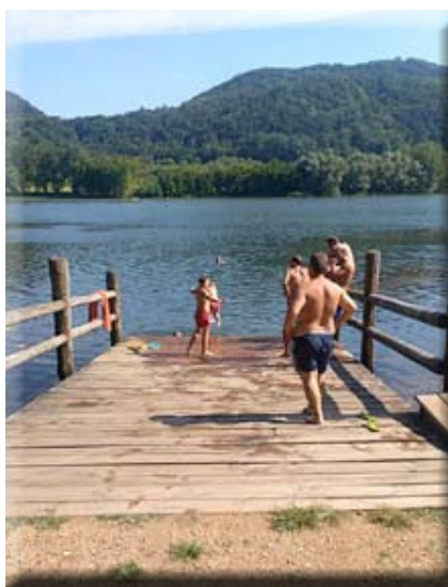
Il lago di Revine