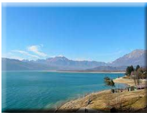
Veduta lago di Santa Croce