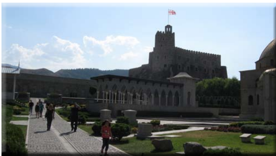
Castello di Akhaltsikhe