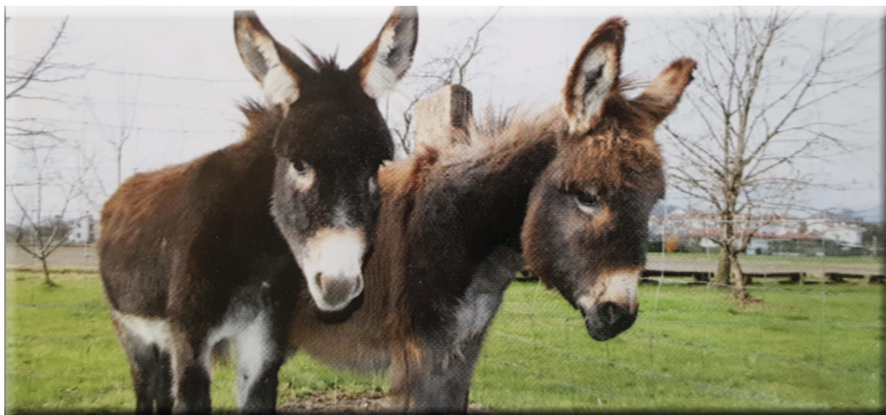
Asinelli di Buja