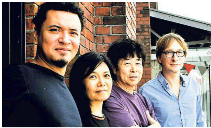
I Kaze stasera in concerto all'Auditorium Santa Margherita